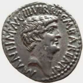
Abb.: Denar des M. Barbatus, 41 v. Chr., Münzstätte Ephesos