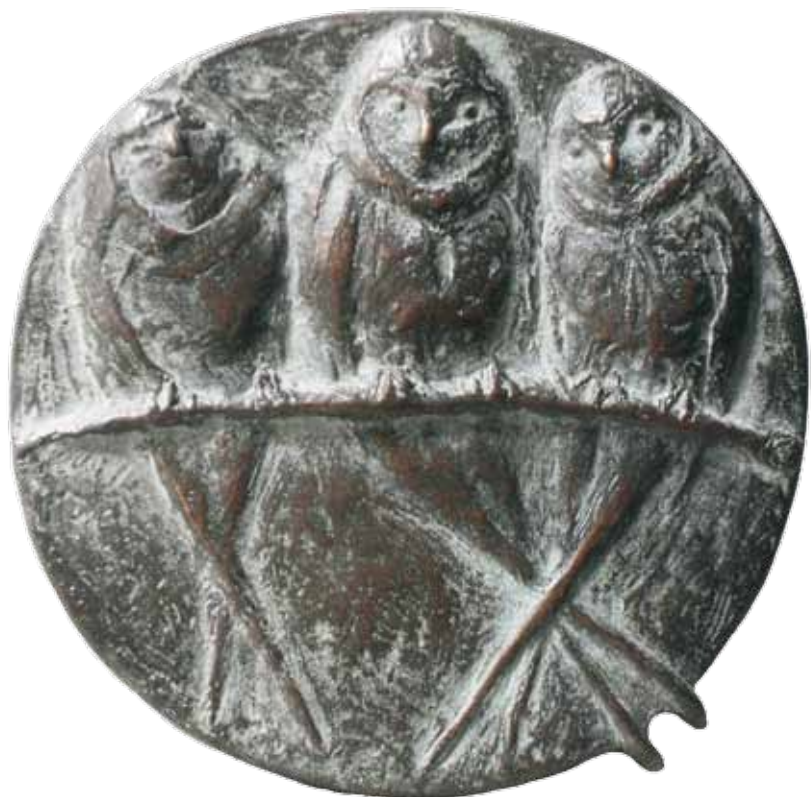
Nr 7 en 7a. Boerenzwaluw, 75 mm Ø, brons, vrij ontwerp 2009. Carla Klein

maakt, terwijl anderen honderden creaties maakten. Dat lijkt een bescheiden oeuvre, maar de kunstenaar heeft nu eenmaal een gedegen wijze van wer-