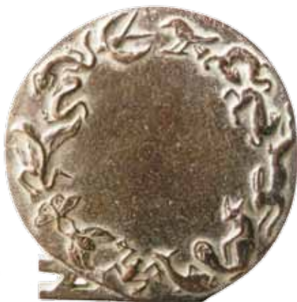
Nr 4 en 4a. Enschede-penning, 83 mm Ø, brons, opdracht 2007. Carla Klein