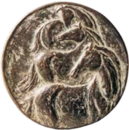
Nr 3 en 3a. Trojka, 81 mm Ø, brons, vrij ontwerp 2005. Carla Klein

het bedrijf. Zo ontstond de Dr. Saal van Zwanenberg-penning (afbeeldingen 5 en 5a). Het portret van Saal van Zwanenberg is naar links gewend. Opschrift: Dr. SAAL VAN ZWANENBERG STICHTING. Op de keerzijde staat een microscoop met daaromheen een esculaap. Het onderste gedeelte dat door de lens gezien wordt is vrij gelaten om er een naam in