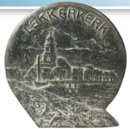
Nr 10 en 10a. Lekkerkerk, 75 mm Ø, brons, opdracht 2010. Carla Klein

Foto's en info: A. Nieuwendam. Voor meer afbeeldingen en informatie kunt u de website van Carla Klein bezoeken: www.bronzen-beelden-carlaklein.nl Voor een lijst met de 250 titels van de artikelen kunt u terecht op de site www.arnaldo.nl/artikelen_penningkunst.htm Documentatiemappen met alle artikelen zijn te vinden in de bibliotheek van het Geldmuseum.