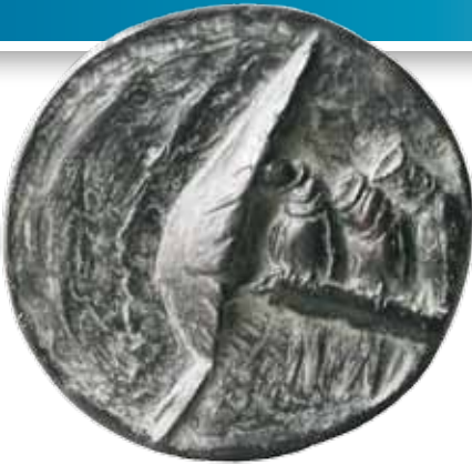
Nr 8 en 8a. Boerenzwaluwen, 75 mm Ø, brons, vrij ontwerp 2009. Carla Klein