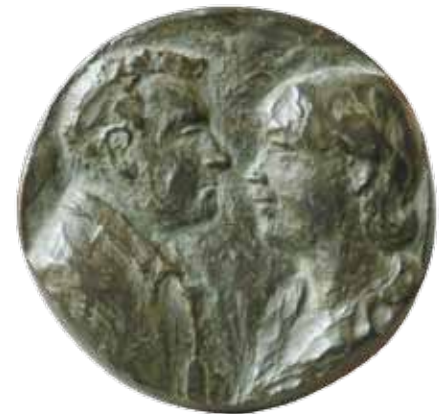
Nr 11 en 11a. Huwelijkspenning, 100 mm Ø, brons, opdracht 2012. Carla Klein