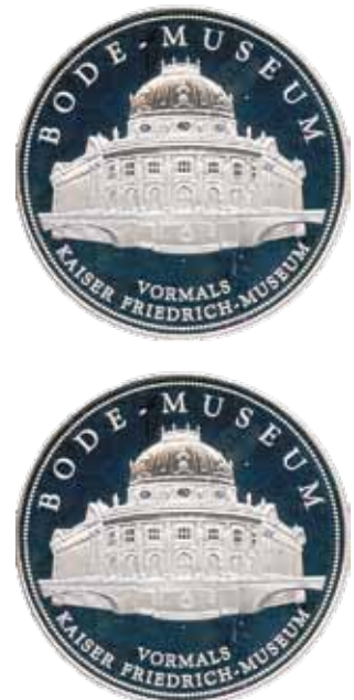
Nr 2. en 2a. Herinneringspenning

een pen met opdruk, het boek Suum Cuique, Medaillenkunst und Münzprägung in Brandenburg-Preußen , en een fraaie herinneringspenning (afbeeldingen 2 en 2a). Dezelfde avond was er als extra een receptie in de KfW Bankengruppe. Tevens was er door het fraaie gebouw een rondleiding onder leiding van Lysann Goldbach (afbeelding 3). Niet alleen de jugendstilornamenten in het gebouw interesseerden velen, maar speciaal de verscheidene vitrines met