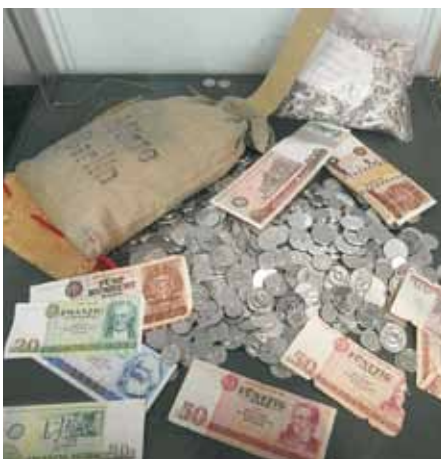
Nr 4. Vitrine met oude munten en biljetten van de DDR