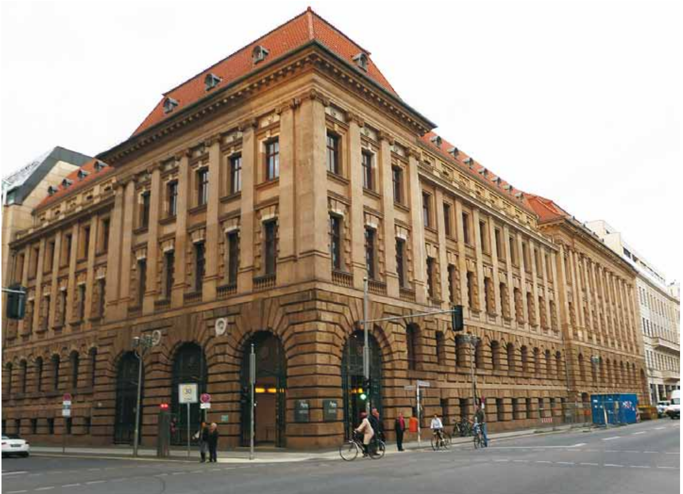
Nr 3. KfW Bankengruppe en rondleiding - Berlin