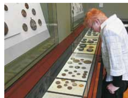
Nr 15. Penningcabinet in het Bode-Museum

daillenkunst und Münzprägung in Brandenburg-Preußen. (Uitgave Staatliche Museen zu Berlin 2008 zie verder http://www.smb.museum/smb/home/index.php ) Steguweit, W. Heidemann, M, en anderen auteurs, Gegossene Sichten und Welten. Peter-Götz Güttler. Katalog der Medaillen 1971-2011 . (Verkoopinformatie via de website van de Duiste penningvereniging: http://www.medailenkunst.de ) Meer informatie penningkunst op http://penningkunst.startpagina.nl