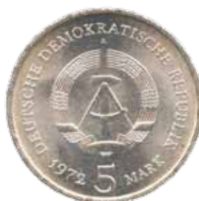
Nr 5. en 5a. DDR 5 mark 1972 „Meissen“