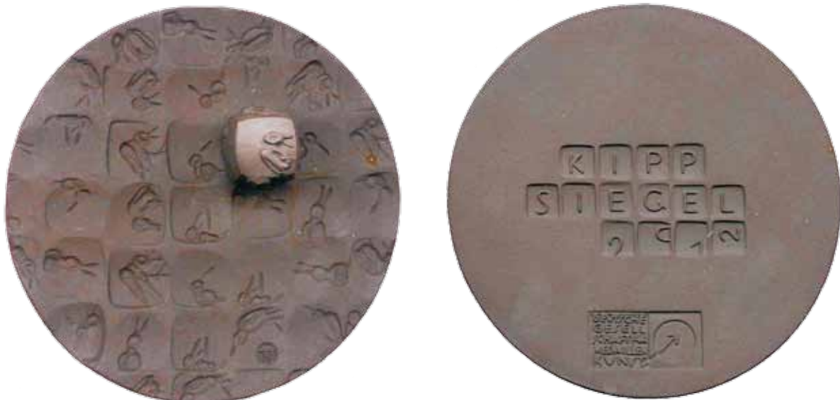
Nr 10 en 10a. Kipp Siegel (rolzegel) 80 mm Ø, brons, 2012 door Thilo Kügler

In de pauzes was er gelegenheid om het museum te bezoeken. Er is daar een grote verzameling oude kunst, speciaal munten en penningen. Het muntkabinet van het Bode-Museum bevat een der