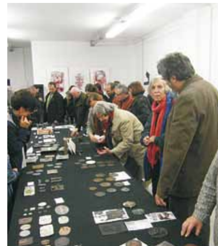
Nr 13. Penningmarkt

Steguweit, W., Kluge, B. Suum Cuique , Me-